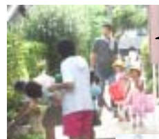
保育所のサークルタイム