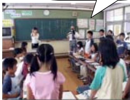
共通話題で課題追求中

7月から9月にかけては、伏見住吉小学校6年生の協力を得て、国語の授業の撮影をさせていただきました。子どもたちが話し合いに積極的に参加しているのに、その声がきれいに収録できなかったりするなど、改めて授業を記録することの難しさを感じましたが、この授業を素材にして、学習課題の提示の仕方や学習を深めるための学級運営のポイント等を明示した研修資料にまとめ上げたいと考えています。短時間で内容の深い研修ができるための全体構成も検討し、効果的な編集の方法についても整理し、提示します。