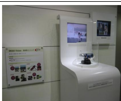
動画顔検出センサ