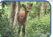
鴨川に現れた小鹿が屋外園にやってきました。 2019年6月3日