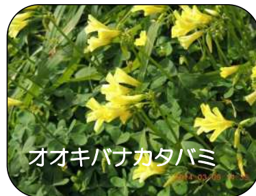
オオキバナカタバミ