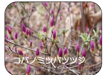
コバノミツバツツジ