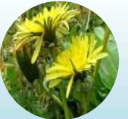
セイヨウタンポポ