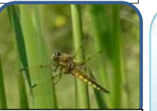
ヨツボシトンボ今年も池で見られました。 2019年5月