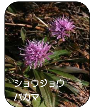
ショウジョウ バカマ