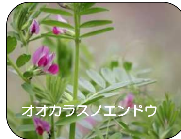
オオカラスノエンドウ