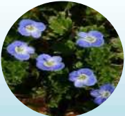
オオイヌノフグリ