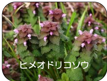
ヒメオドリコソウ