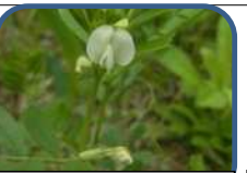
白花のカラスノエンドウが増えました。 2019年4月