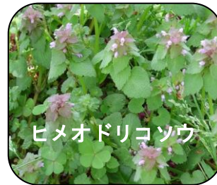
ヒメオドリコソウ