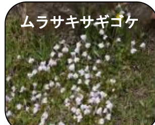
ムラサキサギゴケ