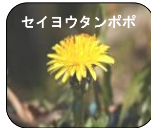
セイヨウタンポポ