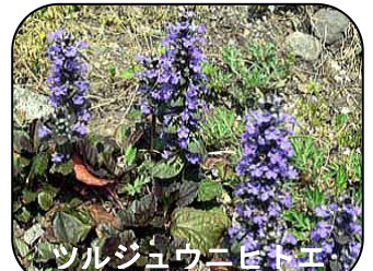
ツルジュウニヒトエ