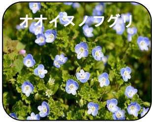
オオイヌノフグリ