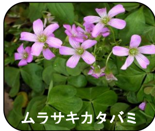
ムラサキカタバミ