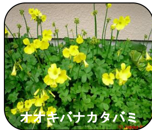
オオキバナカタバミ