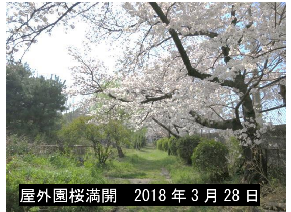
屋外園桜満開 2018年3月28日