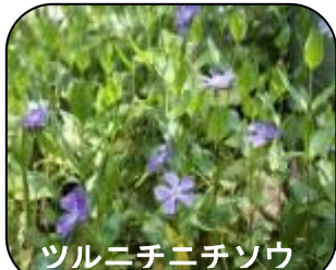
ツルニチニチソウ