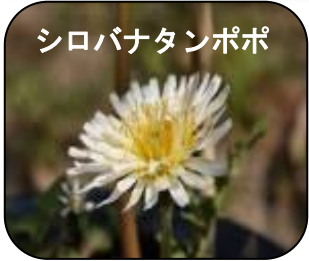
シロバナタンポポ