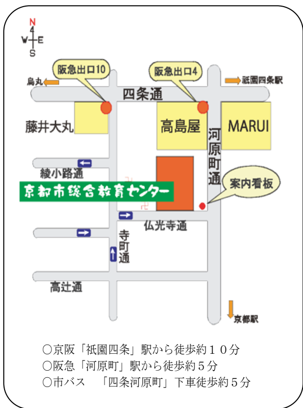
京都市総合教育センター周辺図