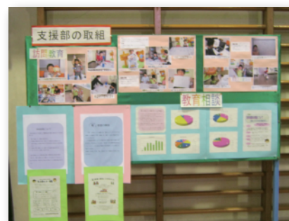
平成 23 年度ポスター発表