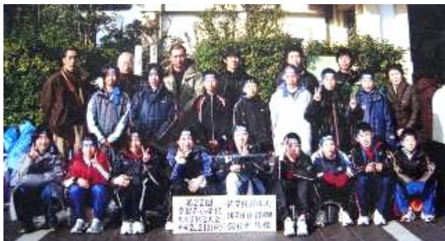
レースが終わって、チームみんなで記念撮影。

2月10日（日）に、大文字駅伝大会が行われました。本校は第16位と健闘しました。前日は雪が降り天候が心配されましたが、当日は厳しい寒さも和らぎ、絶好のコンディションとなりました。選手達は練習で積み上げてきた力を出し切り、10名のメンバーに入れなかった友だちの分も一生懸命がんばりました。ご声援ありがとうございました。