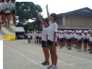
入場行進・開会式