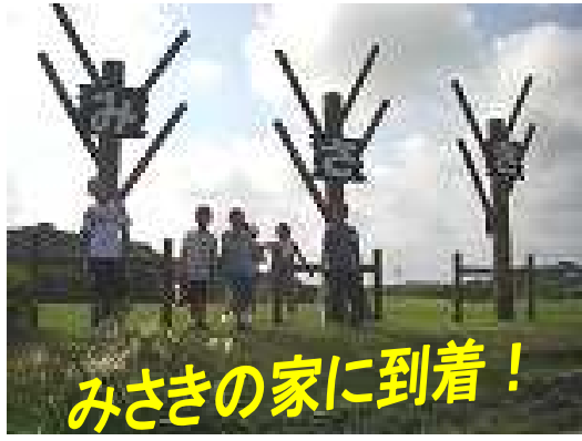
みさきの家に到着！

5年生は、7月24日～26日まで、伊勢志摩にある「奥志摩みさきの家」に野外活動に行きました。天候に恵まれ、暑い中ですが予定した活動をみんな元気に活動にとりくみました。カレー作りやキャンプファイヤー、磯観察などを楽しみました。みんなで協力し、活動する中でたくましくなったように思います。