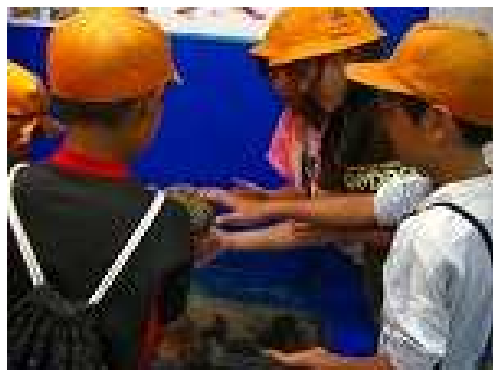
志摩マリンランド