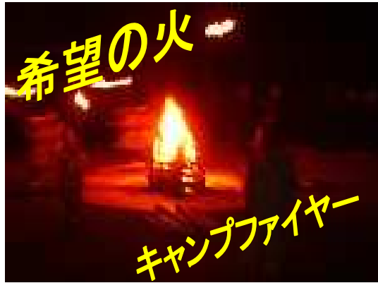
希望の火 キャンプファイヤー