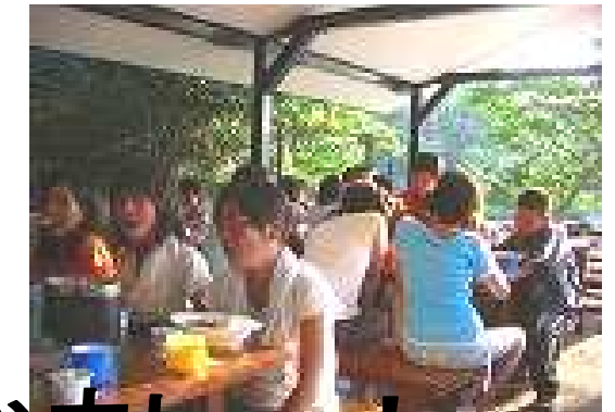
おいしいカレーにとりかカレー！