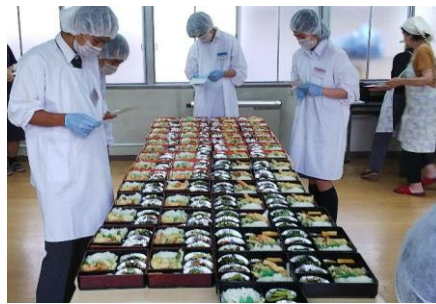
配食サービス (調理)