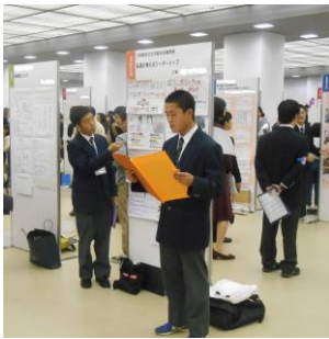
ポスターセッション (堀川高校)