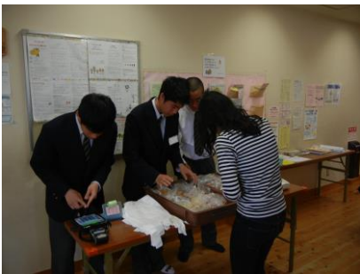
校外でのパン販売