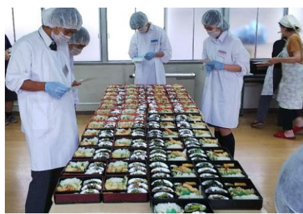
配食サービス (調理)