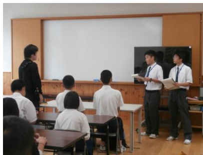
オープンキャンパス