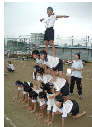
西京祭体育の部での組み体操