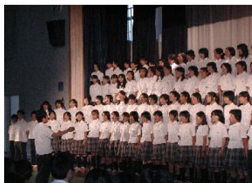
西京祭文化の部での学年合唱