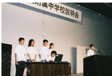
学校説明会・生徒発表の様子