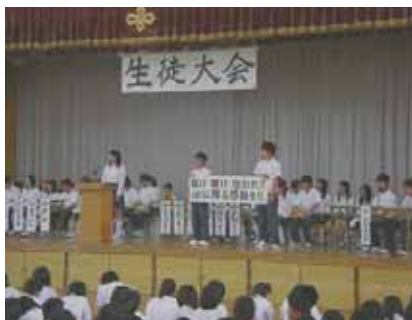
専門委員会の発表