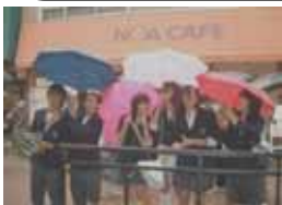
雨の中の都内班別学習