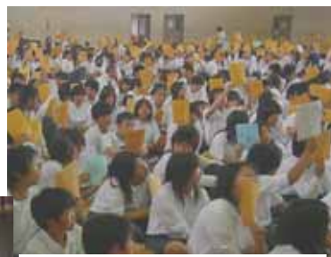
議案書の色による採決

6月19日に生徒総会が行われました。各委員会の方針と予算案が討議されました。各専門委員長はそれぞれの方針説明を原稿を読むのではなく、暗記して発表していました。また、アピールするために、掲示物を作ったりして見ていてわかりやすかったです。最後に「洛南平和宣言」を読みあげられて、すばらしい「生徒総会」でした。この日のために準備した成果が発揮され、全校の生徒も集中していました。20年度の生徒会活動は日常的な活動が充実していて本当によくがんばっています。今後の活動が楽しみです。