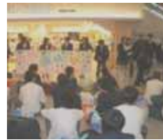
京都駅での出発式

6月3日~5日 3年生が新幹線で関東方面へ修学旅行に行きました。一日目は、山手線沿線を中心とした東京都内の数カ所で先生のチェックを受けながら、班別学習をしました。コンピュータにより居場所がリアルタイムでわかる装置のついた携帯電話を各班に配布し、総合的な管理をしたこともあってスムーズに「サンシャイン 60」に集合できました。その後、バスによる都内の夜景(東京タワーやレインボーブリッジなど)を観賞しました。二日目は、外国からの観光客や修学旅行生でにぎわう東京ディズニーランドへ行き、様々なアトラクションやお土産さがしを楽しみました。