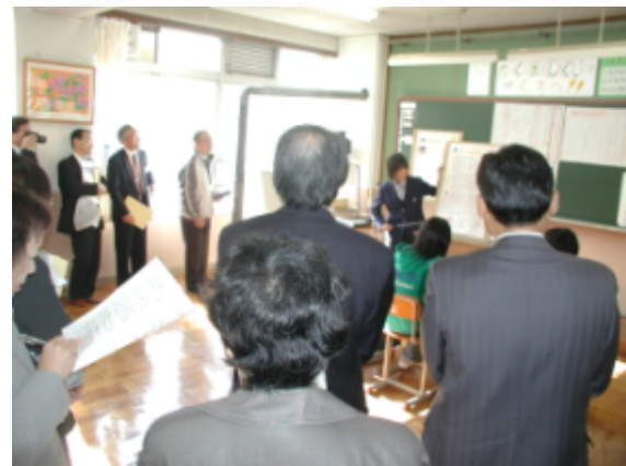
多くの参観者で埋まる小中合同授業

11月17日、本校で開催した研究発表会に、近畿各府県から70名の参加者が来校されました。