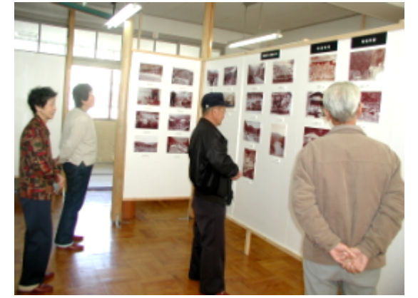
昔の写真を懐かしむ地域の人たち

ふるさとを見つめ直し、ふるさとの良さを再発見する契機になればと開いた「ふるさと小野郷写真展」、11月20日から4日間の開催期間に、70人の人たちが観賞に來られました。