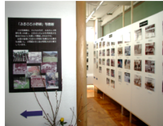
写真200点の展示会場