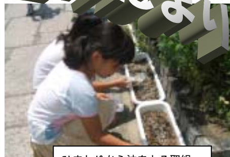
ひまわりから油をとる取組