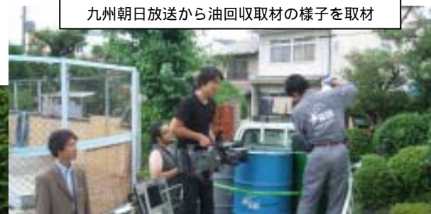
九州朝日放送から油回収取材の様子を取材