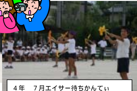
4年 7月エイサー待ちかんてい