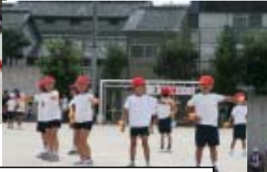
2年 世界に一つだけの花