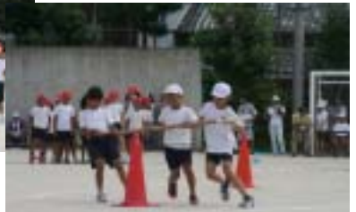
3年 心を合わせてぐるぐるピューン