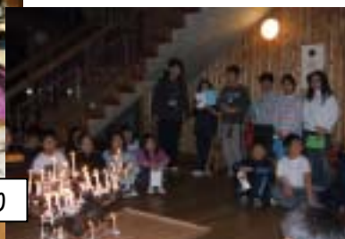
キャンドルファイヤー