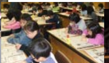
キーホルダーづくり