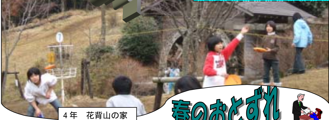
4 年 花背山の家