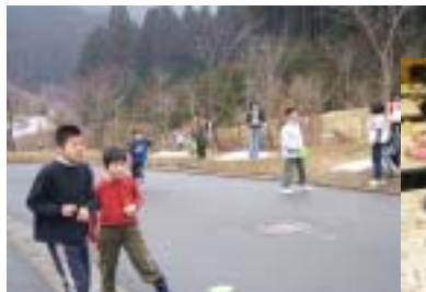
フライングディスクゴルフ