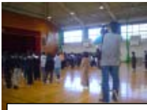
1月9日の朝会の様子

昨日の始業の様子を新聞社の方が取材に来られました。学校長の話，ヨシヨシコンビの算数コーナーなどを見られたあと，4年生の教室で学級指導の様子を取材されました。