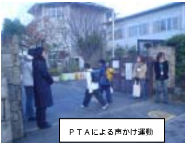
P T A による声かけ運動

子どもたちの元気な声が学校にもどってきました。始業の日、P T A の役員さんが正門と東門に立ち、子どもたちに声かけをしていただきました。しっかり挨拶ができていない子どもがはっきりしているなど感じました。