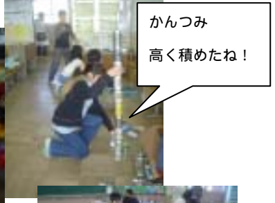
かんつみ 高く積めたね！