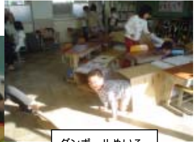
ダンボールめいろ やっと脱出！！