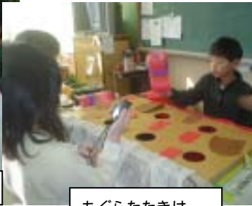
もぐらたたきは、 いつも大人気