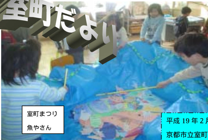
室町まつり 魚やさん