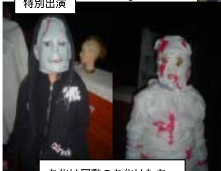
お化け屋敷のお化けたち