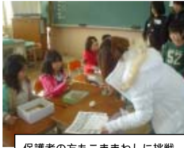
保護者の方もこままわしに挑戦