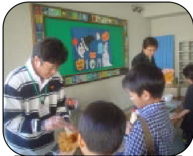
ワイワイ名物たこせん

今年も恒例となりました、PTAのワイワイカーニバルが10月28日(土)に行われました。この日のために、かなり以前よりPTA本部・各委員会の皆様にはご準備をいただきました。今年度も、240名を超える児童が参加しました。実に在籍児童の80%を越えています。