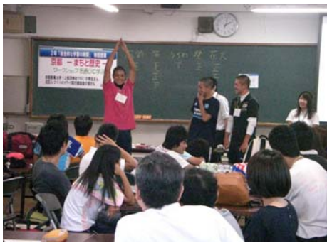
ジェスチャーで伝える

このワークショップでは、京都を題材にして心の豊かさ、自然との共生についての理解を深めること、また世代を超えた人々と一緒に学ぶことでコミュニケーション能力を高めることをねらいにして、様々な課題に生徒が取り組みました。