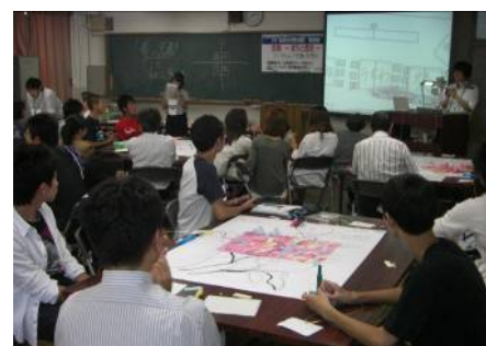
生徒と地域の方々とのグループワーク