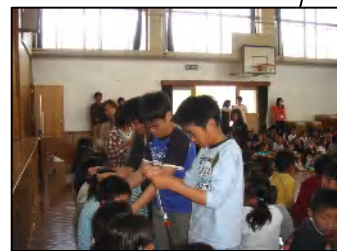
6年生から1年生へ プレゼント渡し