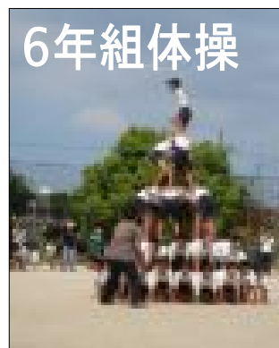
午前のプログラム最後の種目 6年組体操「絆」力を合わせ、最高 の集中力で堂々と演じてくれました。