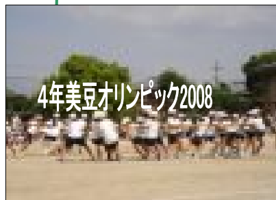
4年美豆オリンピック2008