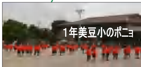
1年美豆小のポニョ