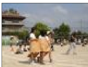
つばさ学級の児童と5年生全児童による 交流種目「でかパンレース」