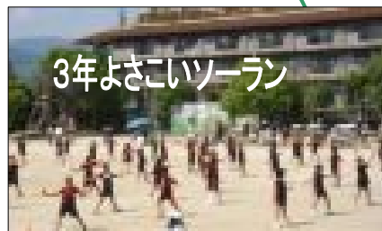
3年よさこいソーラン