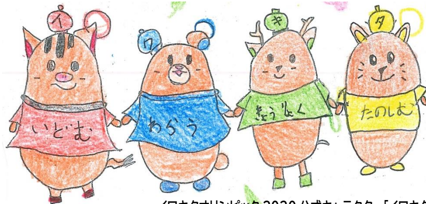
イワキタオリンピック 2020 公式キャラクター「イワキターズ」