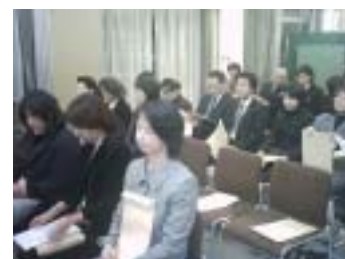
<推進委員の皆様方>

年末の12月13日(木)午後6時より、「稲荷小学校 学校運営協議会」の発足式がありました。「学校運営協議会(コミュニティ・スクール)」とは、開かれた学校づくりを推進するために、平成16年度に法制化された制度で、本校は今回、京都市で92校目に発足したことになるそうです。