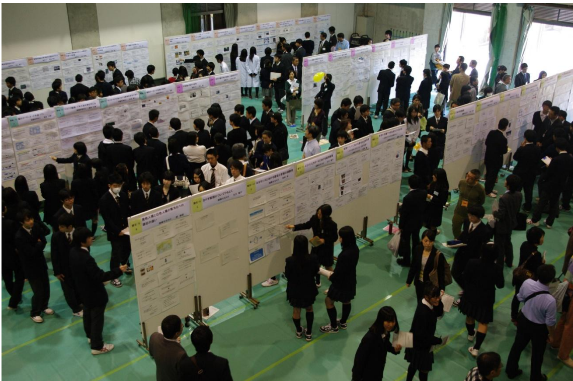
大勢の方が来てくれました。