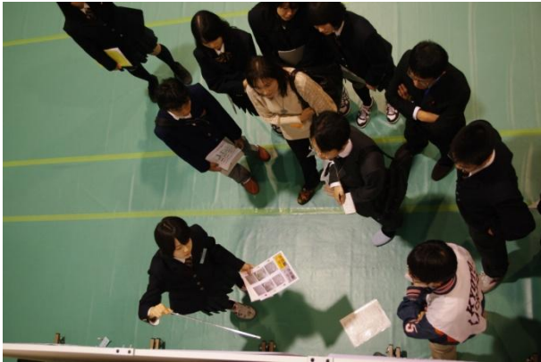
多くの人に囲まれての発表です。