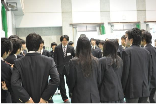
ゼミごとに集まり，士気を上げました。