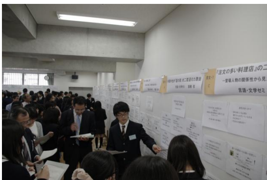
いよいよ発表です。