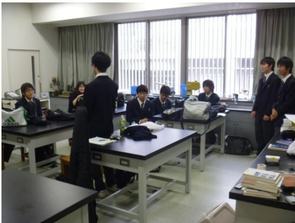
最後にゼミ会でポスター発表会のことや今までの研究を振り返りました。