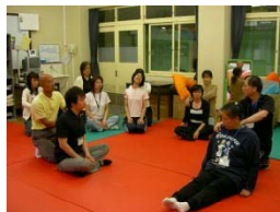
総合育成支援教育研修会