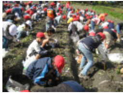
2年 多賀フルーツライン