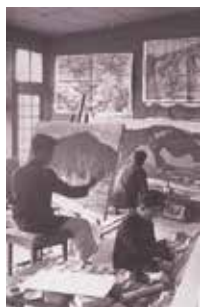
日吉ヶ丘高校時代