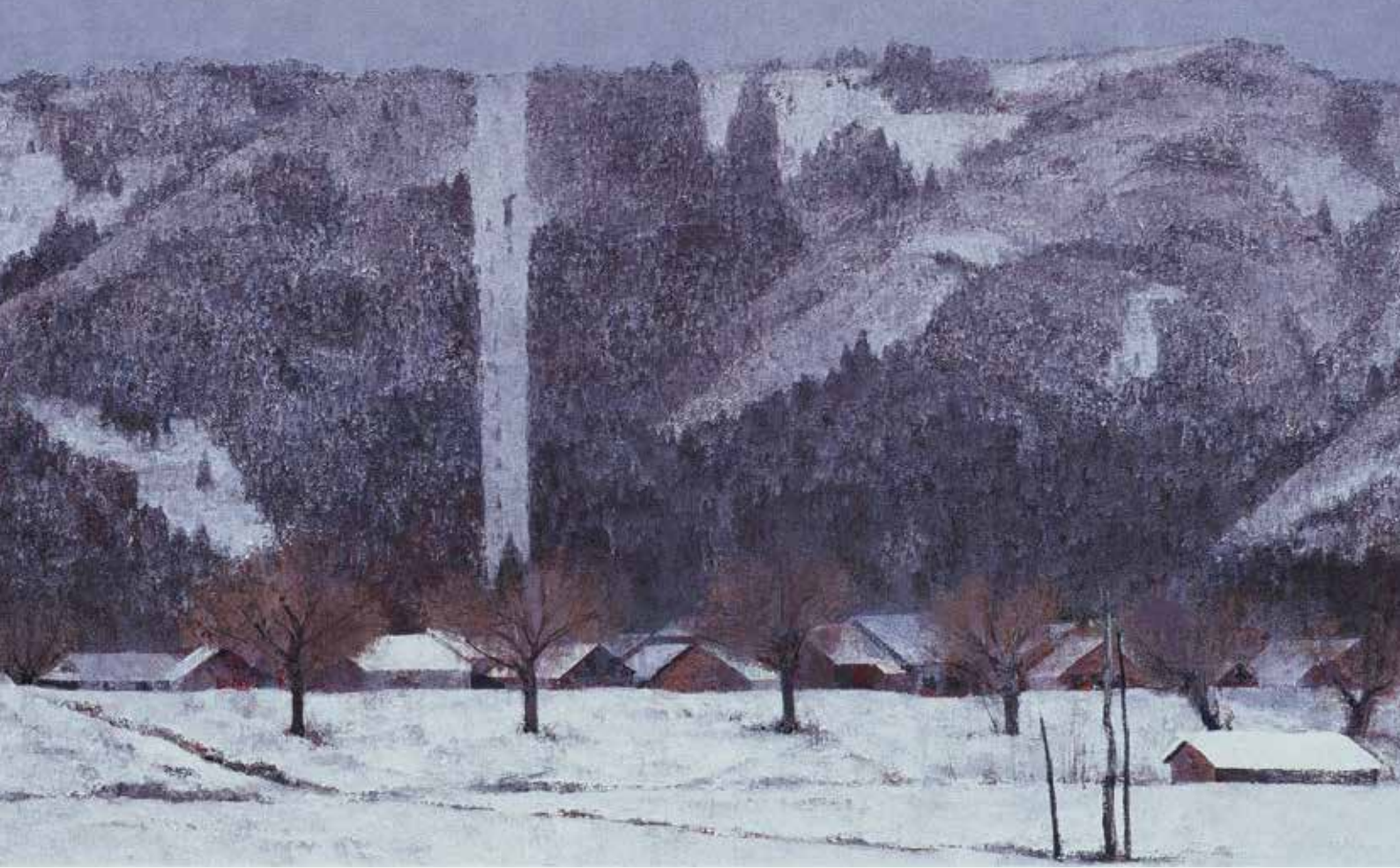
中路 融人「雪の賤ヶ岳」