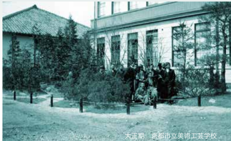
大正期 京都市立美術工芸学校

本校は、1880年(明治13)年、「京都府画学校」として京都御苑内に創立して以来、今年で創立138年目を迎えました。この間、多くのすぐれた作家を輩出し、卒業生は美術界、産業界、教育界で活躍されておられます。今年3月に「京都市立芸術大学移転整備計画」が決定され、6年後2023年に京都市立芸術大学が京都駅東部崇仁地域へ移転されることにあわせて、本校も同地域への移転することとなりました。これを機会に、「所蔵作品展」を開催し、本校ゆかりの優れた作家の作品を広く市民の皆様にご観覧いただき、歴史と伝統ある本校の美術教育にご理解をいただければと存じます。第1回は、創立当初中心となった日本画、さらに彫刻の作品を展示いたします。多くのご観覧をお待ちしております。