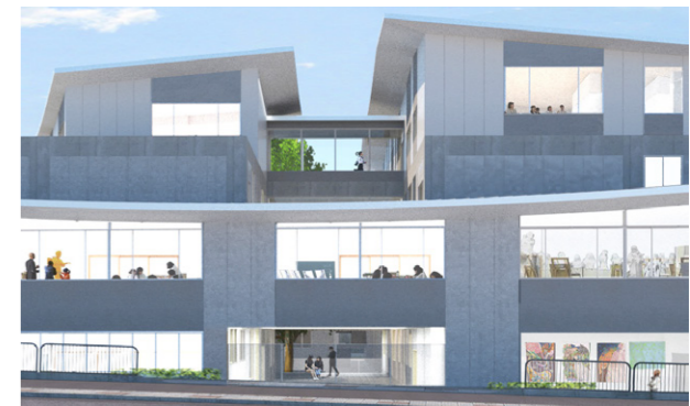
北面からの各部屋