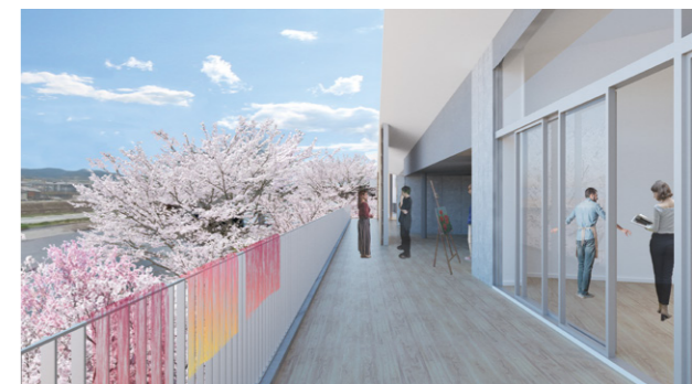
東面 2F ホームルーム教室前バルコニー