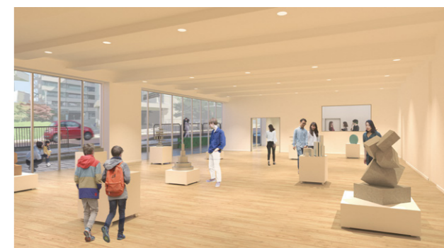
北面 1階多目的ホール