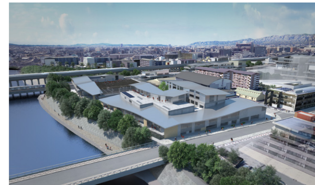
校舎全体イメージ