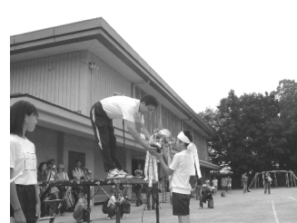
優勝カップ授与(白組)

心配された天気も、当日には運動会日和となりました。進級して間もない5月から取組んだ練習でしたが、全員が競技や演技に力を出し切り、精一杯応援する姿を見ることができました。さらに、高学年は係の仕事もスムーズにこなしました。これらの経験が、今後の学校生活の様々な場面で、子どもたちの『力』となって生きて働くことと思います。