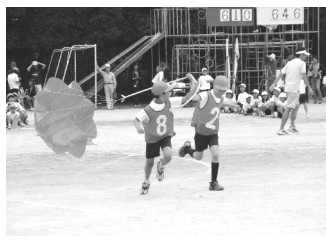
3年ジェット気流に乗ろう