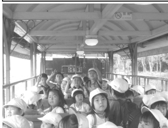
あおぞら・1・2年生 梅小路公園

5月14日(水)～15日(木)には、6年生が修学旅行に行ってきました。一日目は、名古屋市立科学館、トヨタ自動車を見学した後、恵那峡国際ホテルで一泊しました。二日目は、馬籠宿、リトルワールドを見学しました。楽しい思い出がいっぱいできた二日間でした。