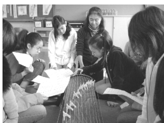
3年社会：京漆器教室 1/8